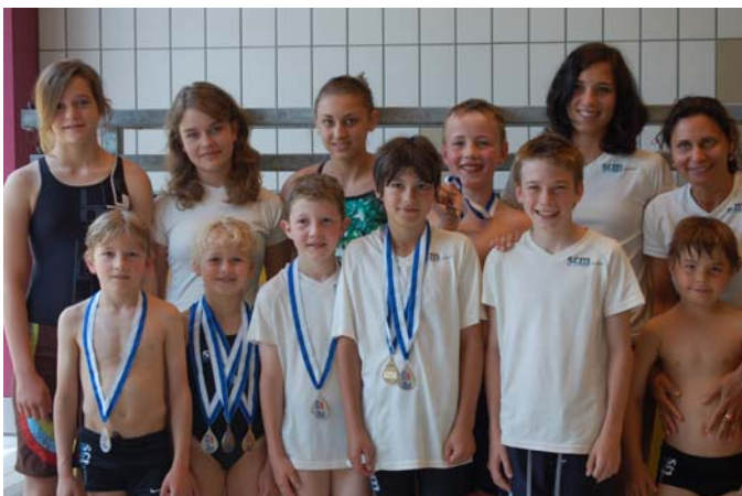
Erfolgreiche Nachwuchsschwimmer am Eulach-Meeting

„Unter den Nachwuchsschwimmern herrscht ein toller Teamgeist“